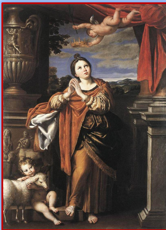
Santa Inés (Domenichino, Óleo sobre tela, 1620)