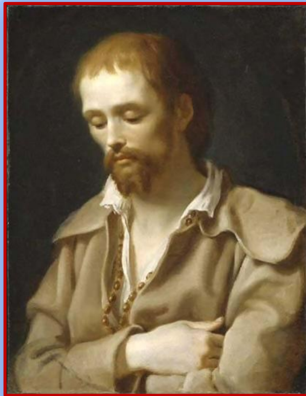
San Benito José Labre (Terciario trinitario), por Antonio Cavallucci, hacia 1795, Museum of Fine Arts, Boston (USA)