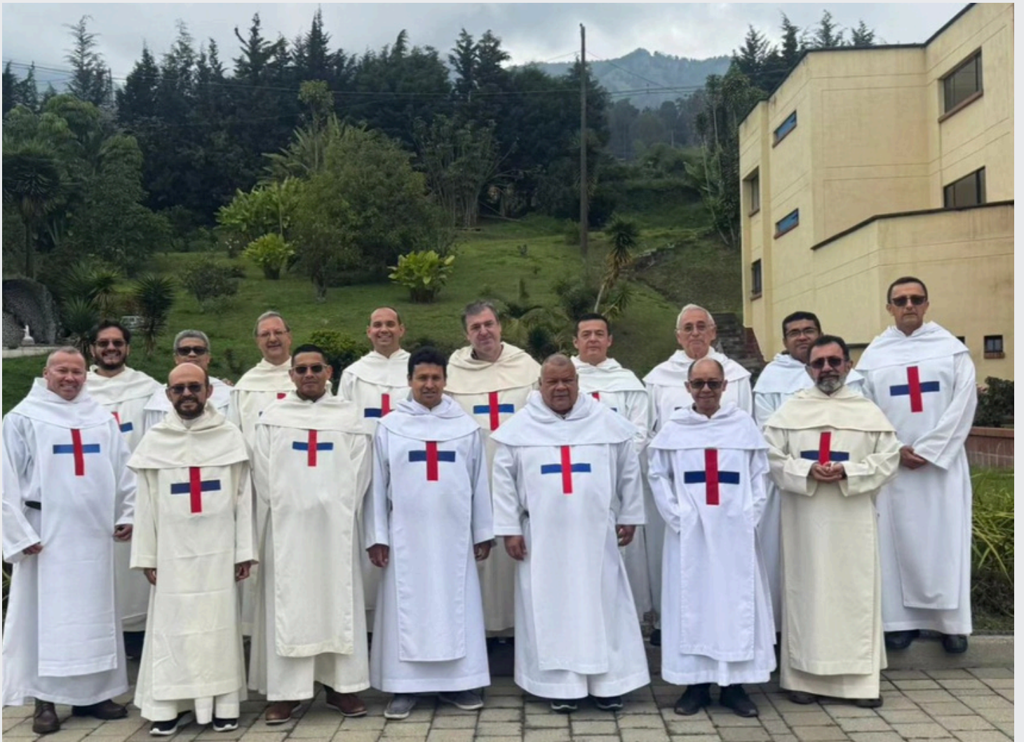
Lione-Francia: Professione perpetua