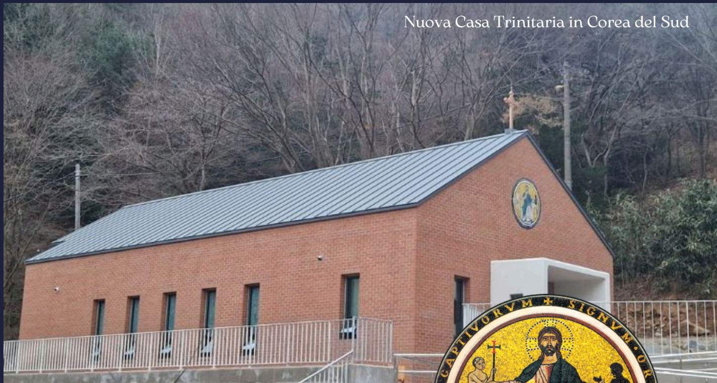
Nuova Casa Trinitaria in Corea del Sud